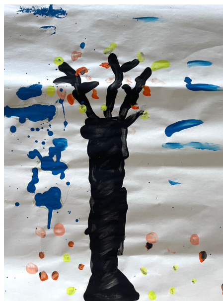
Dessin de Maé, 6 ans