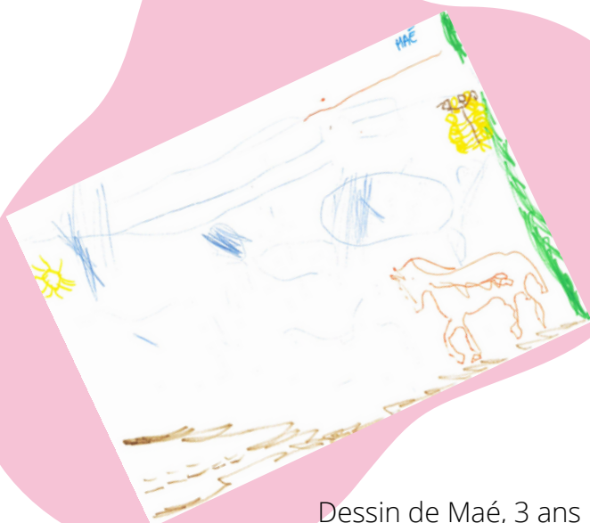
Dessin de Maé, 3 ans

Attention, les inscriptions se font par le biais du flyer joint à ce numéro, et sont à retourner en mairie pour le 1er décembre.